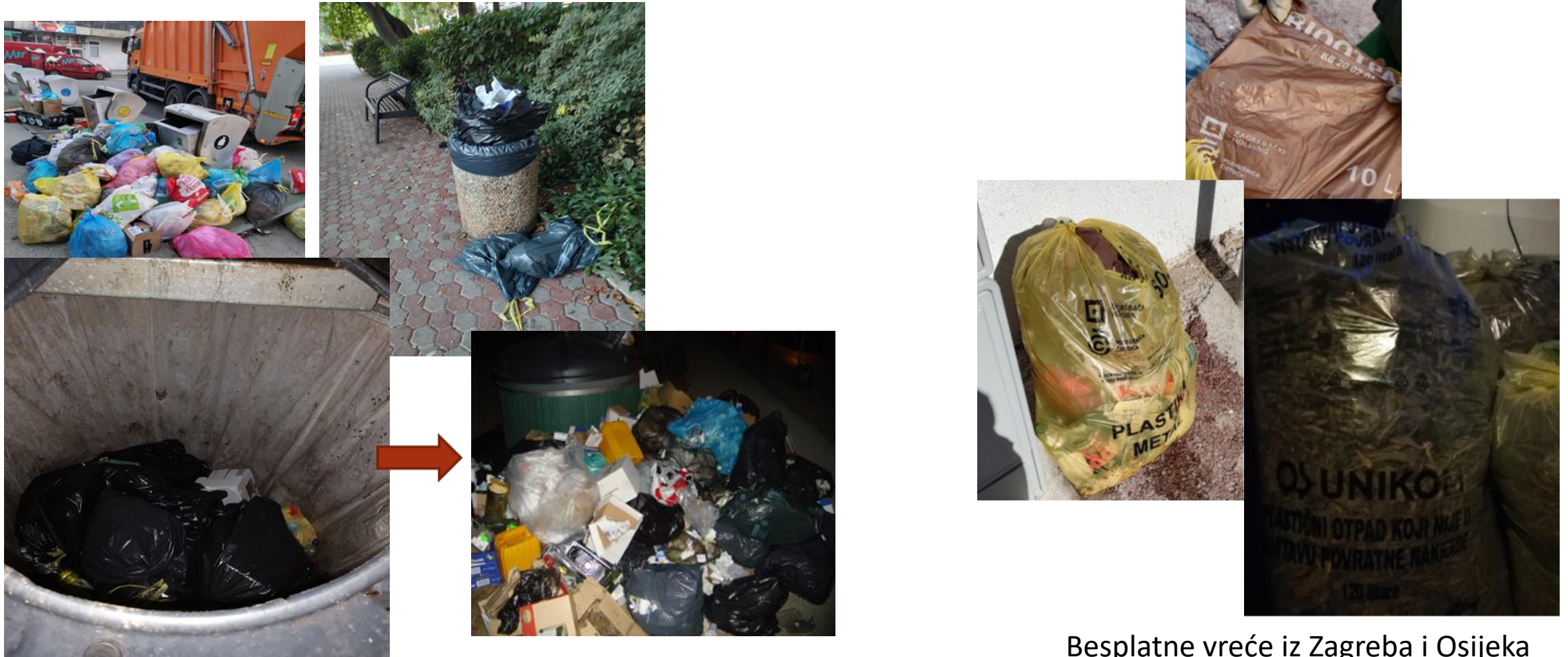
Besplatne vreće iz Zagreba i Osijeka iskorištene za MKO u Crikvenici